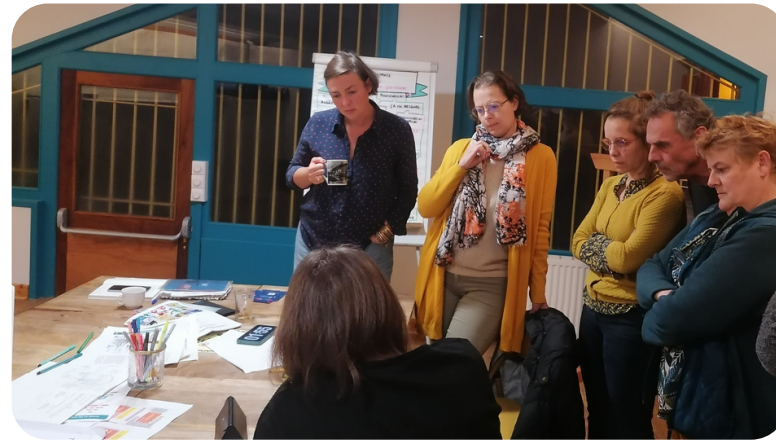
Des temps de formation thématiques