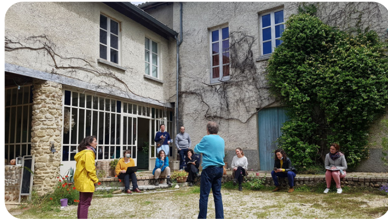
Des visites inspirantes avec partage d'expérience

3 jours de formation et d'échanges sur le terrain pour consolider un projet de tiers-lieu sur son territoire