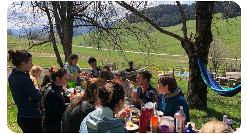
Des temps de partage et de convivialité