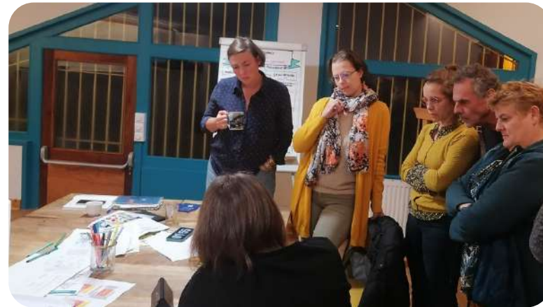
Des temps de formation thématiques