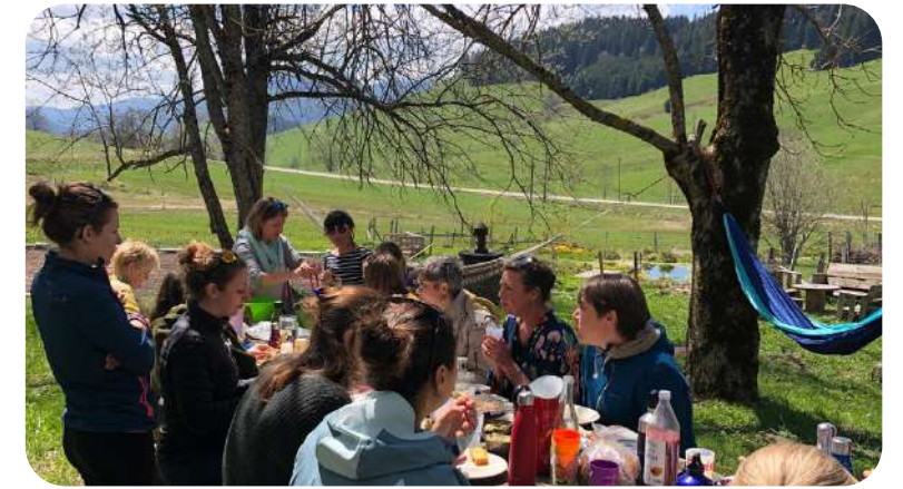
Des temps de partage et de convivialité