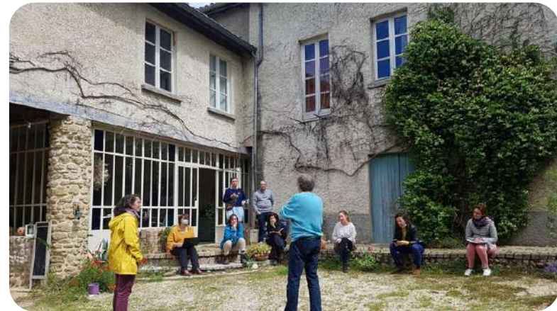
Des visites inspirantes avec partage d'expérience

3 jours de formation et d'échanges sur le terrain pour consolider un projet de tiers-lieu sur son territoire